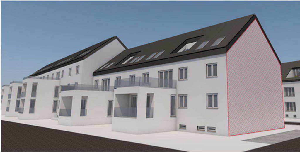
Abbildung: Sanierung der Nebeniusstraße 12-20 in Frankfurt: Anbauten und der Ausbau des Dachgeschosses bieten neuen Wohnraum. Die unverschattete Südfassade (rote Fläche) wird im Projekt mit OPV belegt.